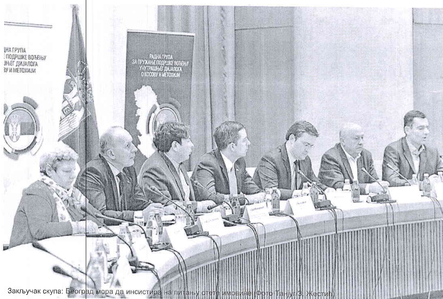
Zaključak skupa: Beograd mora da insistira na pitanju otete imovine

E konomski stručnjaci u okviru unutrašnjeg dijaloga o Kosovu su se složili da se mora insistirati na pitanju otete i uzurpirane imovine Srbije na Kosovu i Metohiji, kao i da se mora nastaviti razvijanje ekonomskih odnosa. To je izjavio generalni sekretar predsednika Republike Srbije Nikola Selaković, uz ocenu da je izlaganje ekonomista bilo korisno i egzaktno i da je podrazumevalo i analizu tržišta, stanovništva, ali i sve ono što nisu „puke” brojke, da bi se došlo do prognoza u vezi sa ekonomskim razvojem.