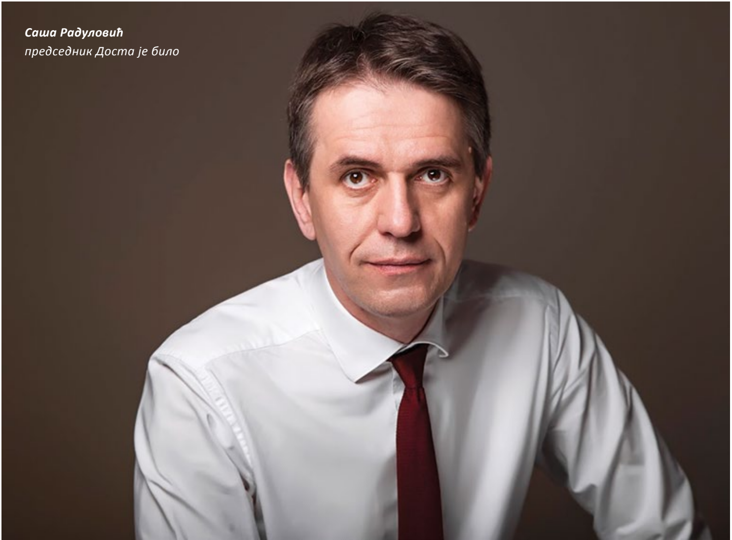
Саша Радуловић председник Доста је било

Н е прође дан да у неком од медија или портала који важе за опозиционе не осване коментар неке јавне личности или новинара који себе декларишу опозиционим о томе како опозиција тобоже нема идеје и програм. Са друге стране говоре о томе како је опозиција немоћна и како не може да се уједини. Око чега да се уједини? Око оне идеје и програма за које се каже да не постоје? И ко је стварно опозиција?