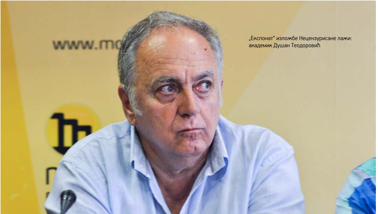
„Експонат“ изложбе Нецензуриране лажи: академик Душан Теодоровић