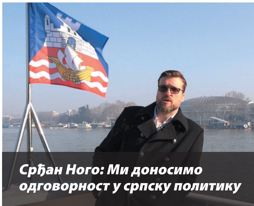
Срђан Ного: Ми доносимо одговорност у српску политику