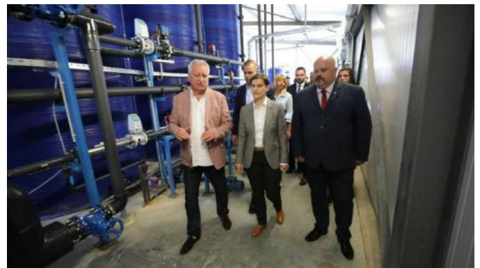
Premijerka Ana Brnabić u obilasku fabrike za prečišćavanje vode u Zrenjaninu

Druga važna stvar koju smo uspjeli da definišemo je krajnji rok do kada bi zaista moralo da se sazna sve o postrojenju i kvalitetu prečišćene vode. Realan datum ponovnog puštanja u rad bio je sredinom jula. Složili smo se onda da je period od naredna dva meseca sasvim dovoljan da se podese parametri rada i da se izveše sva merenja. Dakle polovinom septembra trebalo je da znamo sve. Valjan razlog za raskid ugovora jeste to što nakon izvršenih merenja rezultati očito nisu zadovoljavajući, budući da čista voda zvanično još nije potekla iz zrenjaninskih česmi.